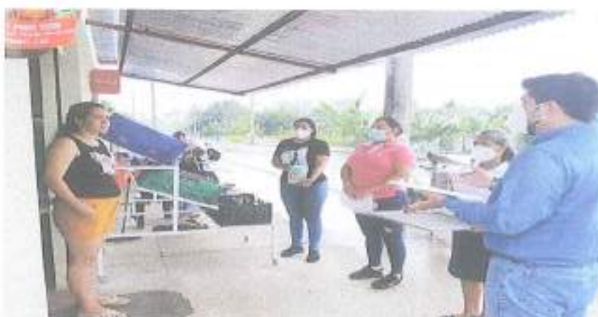
Dotación de materiales de desinfección contra COVID-19 por parte de Petroecuador a las tiendas de la Parroquia Enokanqui.