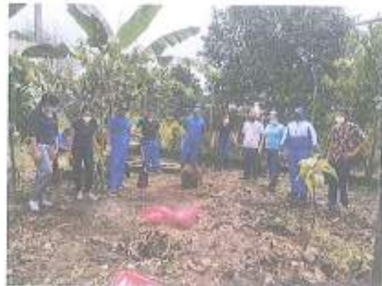
Minga comunitaria en beneficio del C.S Enokanqui.