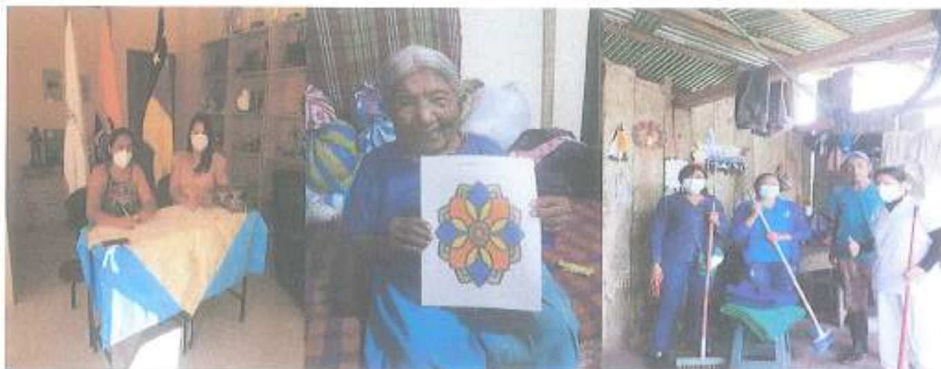
Convenio MIES para atención domiciliaria a personas adultas mayores 2021.

Acuerdo Ministerial N° 0996- Publicado el 09 de Agosto de 1988 Enokanqui - Sacha - Orellana - Ecuador RUC: 2260004610001