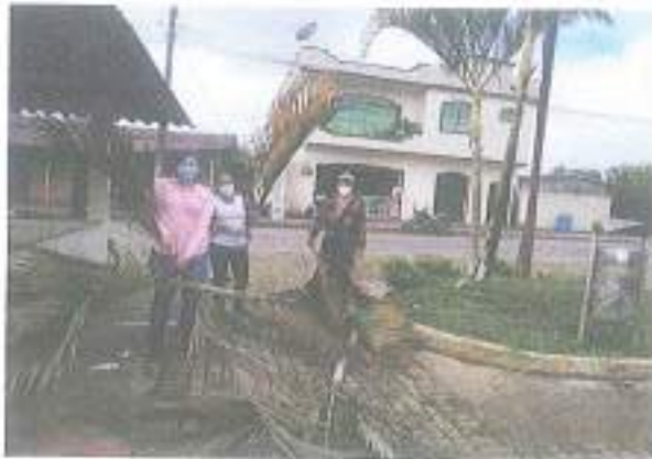
Minga de poda de árboles con exceso de vegetación-Parterres Enokanqui.

Acuerdo Ministerial N° 0996- Publicado el 09 de Agosto de 1988 Enokanqui - Sacha - Orellana - Ecuador RUC: 2260004610001