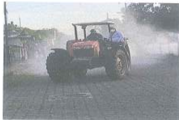
Fumigación contra COVID-19 dentro de la Parroquia Enokanqui.